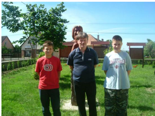
11. ábra informatikások