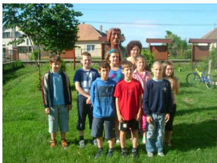
6. ábra 4. osztály

Pink B. Lilla - szépkiejtési verseny , Gödöllő