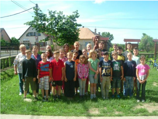
13. ábra atlétikások