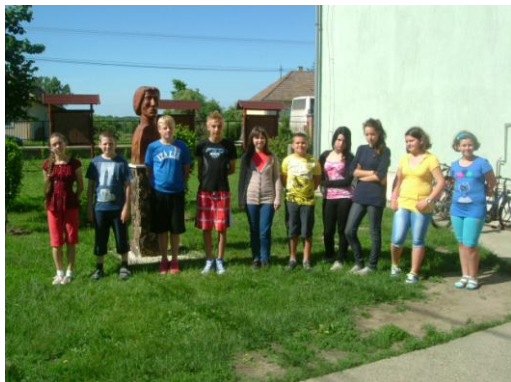
10. ábra angolosok